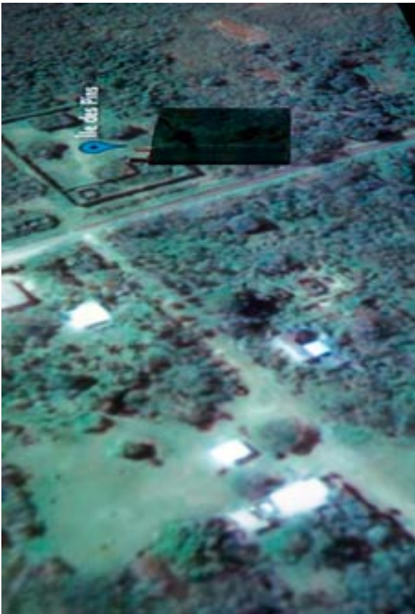
L'île des Pins.

Les livres de Louis Barron mettent en évidence l'évolution sociale de la région, l'importance culturelle de telle ville, les habitudes sociales des ouvriers et de tous les habitants... Par exemple il est décrit un usage commun de cette époque : les ouvriers font la sieste dans la rue, chose qui existe encore en Asie, mais est totalement impensable dans la France d'aujourd'hui... Par son témoignage ethnologique, sociologique et historique particulièrement pertinent, Louis Barron montre qu'il est un auteur engagé et très concerné par la vie des gens du peuple.